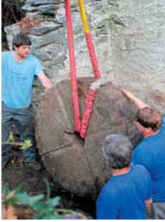
Un gruppo di abitanti di Corzoneso si è costituito in associazione per rimettere in funzione il vecchio Mulino. (p. 6)